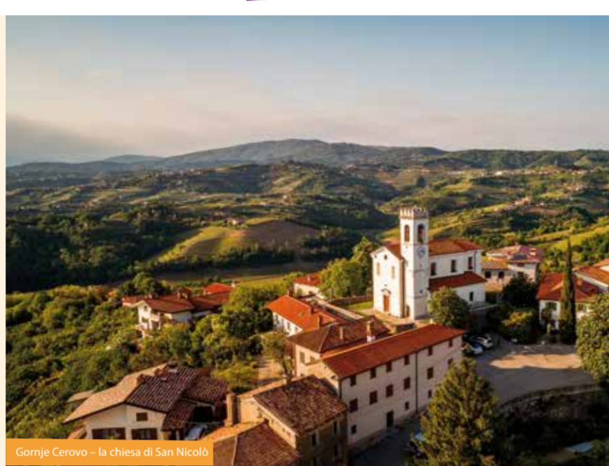
Gornje Cerovo - la chiesa di San Nicola